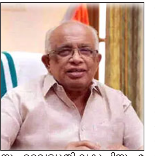
മണിയാർ പദ്ധതിയുടെ കരാർ നിടുമ്പതിൽ സർക്കാർ തലത്തിൽ ദിന്നത. മണിയാർ പദ്ധതിയുടെ കരാർ നിടുമ്പതിൽ സർക്കാർ തലത്തിൽ ദിന്നത.

തിരു: മണിയാർ ജലവൈദ്യുത പദ്ധതിയുടെ കരാർ തീരുമാനമായി ബന്ധപ്പെട്ട നീട്ടുന്നതുമായി സർക്കാർ തലത്തിൽ ദിന്നത. മണിയാർ പദ്ധതിയുടെ കരാർ നിടുമ്പതിൽ സർക്കാർ തലത്തിൽ ദിന്നത. മണിയാർ പദ്ധതിയുടെ കരാർ നിടുമ്പതിൽ സർക്കാർ തലത്തിൽ ദിന്നത. മണിയാർ പദ്ധതിയുടെ കരാർ നിടുമ്പതിൽ സർക്കാർ തലത്തിൽ ദിന്നത.