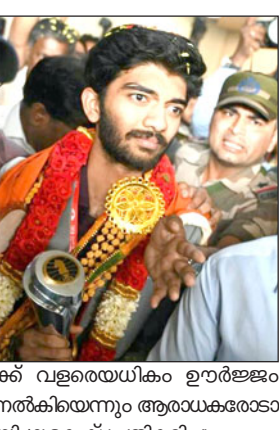
ചെപ്പ് ലോകചമ്പ്യൻ ജനനാട്ടിൽ വൻസ്മിരണം.

ചെപ്പ് ലോകചമ്പ്യൻ ജനനാട്ടിൽ വൻസ്മിരണം. ചെപ്പ് ലോകചമ്പ്യൻ ജനനാട്ടിൽ വൻസ്മിരണം.