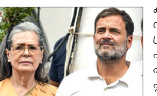
സോണിയയുടെ കൈവശമുള്ള നെഹ്റുവിന്റെ സ്വകാര്യകത്തുകൾ തിരികെ നൽകണം'; രാഹുലിന് കത്തയച്ച് പി എം എം എൽ.