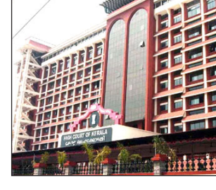
ക്യാമ്പസിലെ രാഷ്ട്രീയകളെ അവസാനിപ്പിച്ചാൽ മതിയെന്നും കേരള ഹൈക്കോടതി.

കൊച്ചി: വിദ്യാർത്ഥി രാഷ്ട്രീയം അവസാനിപ്പിക്കേണ്ടതില്ലെന്നും ക്യാമ്പസിലെ രാഷ്ട്രീയകളെ അവസാനിപ്പിച്ചാൽ മതിയെന്നും കേരള ഹൈക്കോടതി. മതത്തിന്റെ പേരിലുള്ള കുറ്റകൃത്യങ്ങളുടെ പേരിൽ മതം നിരോധിക്കാറില്ലെന്നും കോടതി ചോദിച്ചു. വിദ്യാർത്ഥി രാഷ്ട്രീയം നിരോധിക്കണമെന്ന പൊതുതാൽപര്യ ഹർജി പരിഗണിക്കുവേയാണ് ഹൈക്കോടതിയുടെ നിരീക്ഷണം.